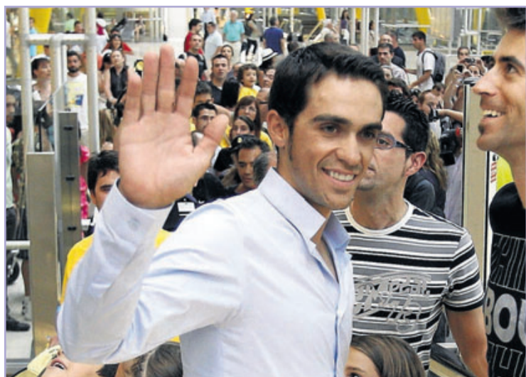
Alberto Contador se presentará hoy con Saxo Bank en Copenhague